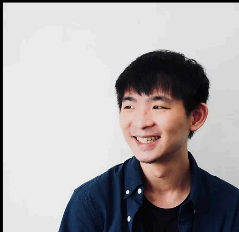
音樂設計 | 陳致霖