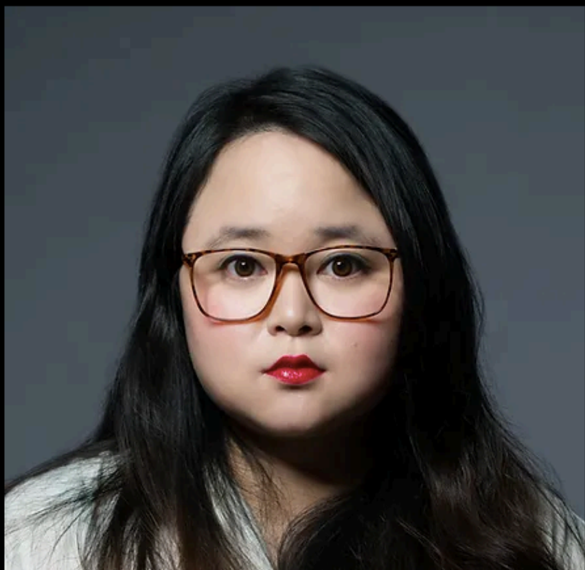
燈光設計 | 周佳儀