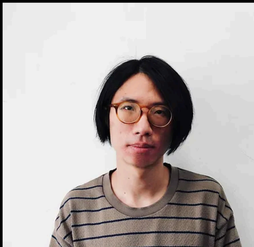
音樂設計 | 徐平