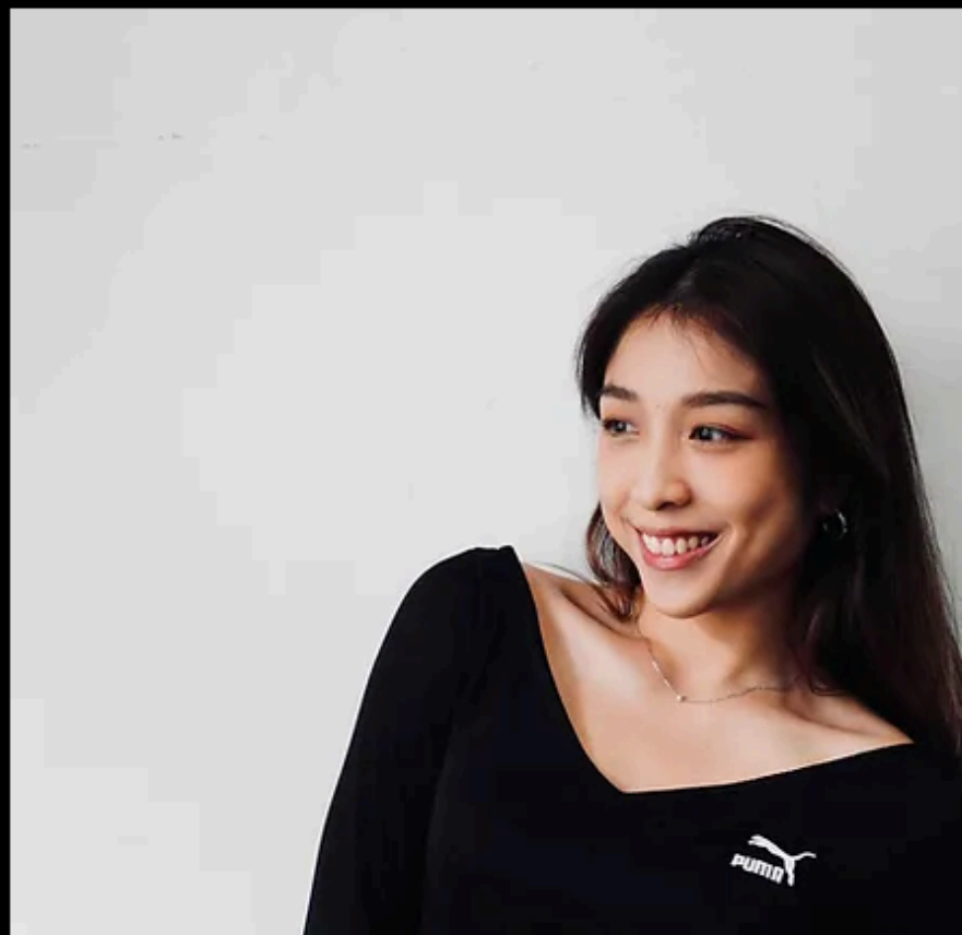
執行製作 | 吳蕙安