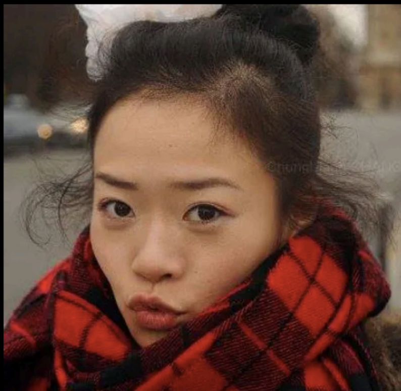
導演 | 方意如