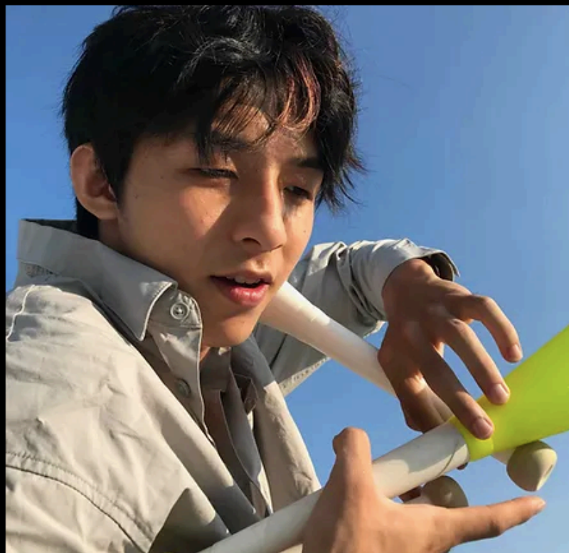
演員 | 蘇俊諺