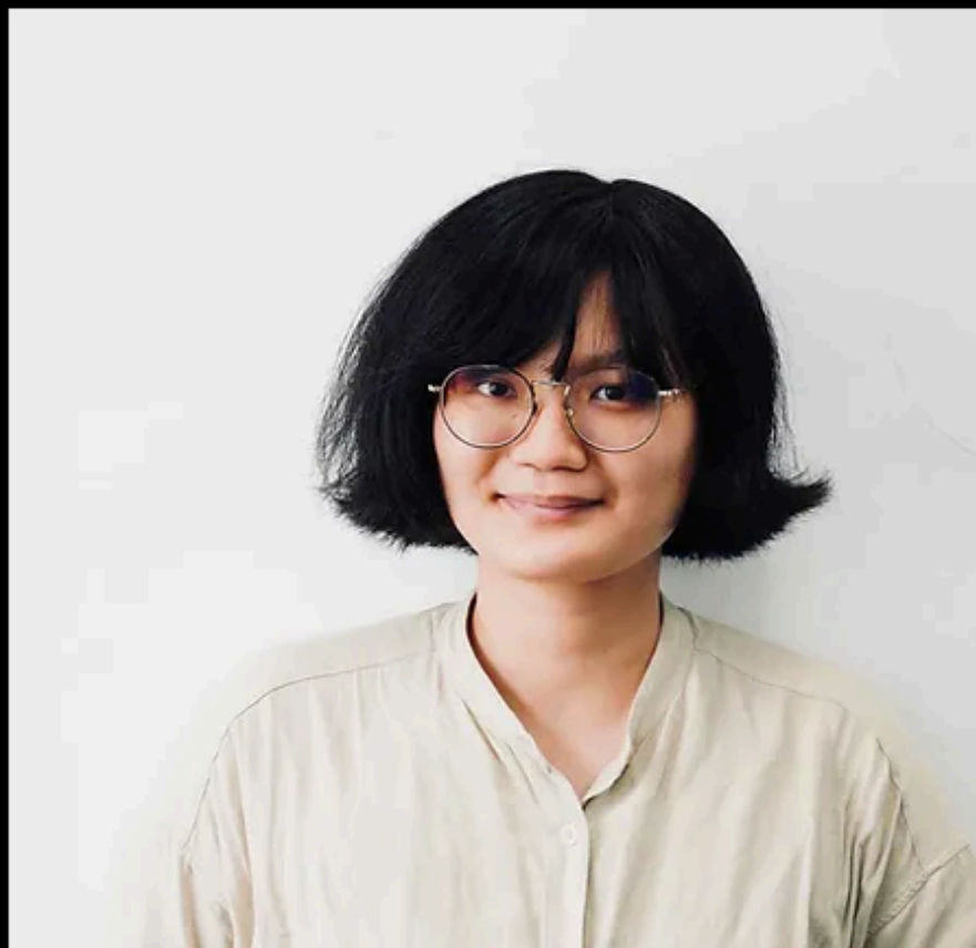
舞台及空間設計 | 吳紫莖